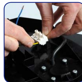
Bornier à connexion rapide sans vis