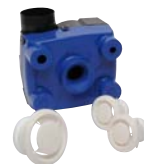
Caisson FACILIO Autoréglable