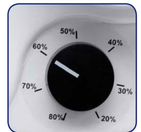
Hygostat manuel réglable 20/80% HR pour la version Hygrovariable