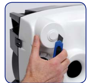
2 piquages sanitaires transformables 15 ou 30 m³/h