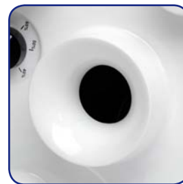
Piquage VENTURI en cuisine

Ventilation Mécanique Contrôlée pour logement de 2 à 7 pièces principales, équipé d'1 cuisine et de 2 à 4 sanitaires.