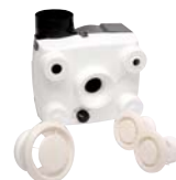
Caisson FACILIO HV Hygrovariable