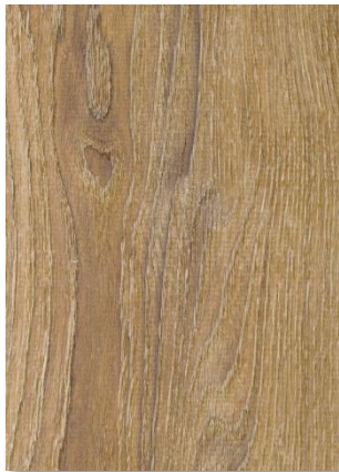
622 Chêne Baléares