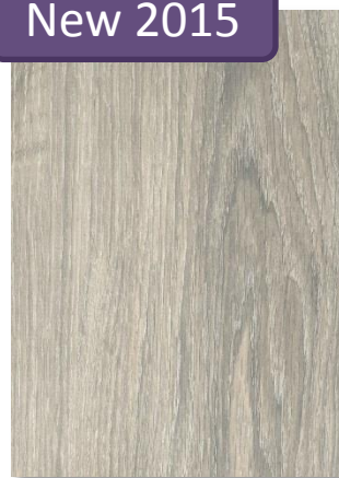
628 Chêne Majorque