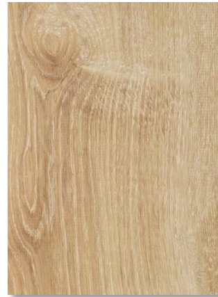
621 Chêne Canaries