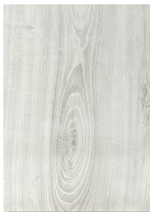
627 Chêne polaire