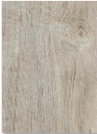
619 Chêne Sardaigne