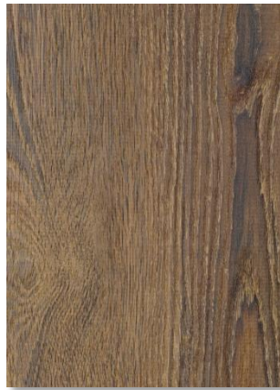
620 Chêne Corse