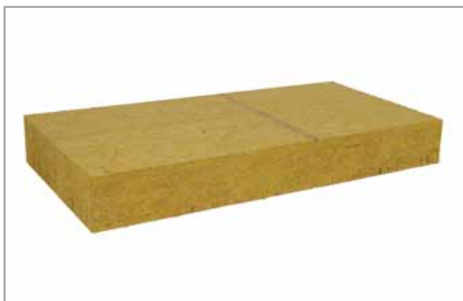
Face supérieure sur-densifiée repérée par un marquage qui varie selon les produits.

Panneau de laine de roche double densité rigide et durci en surface utilisé pour l'isolation des façades sous enduit.